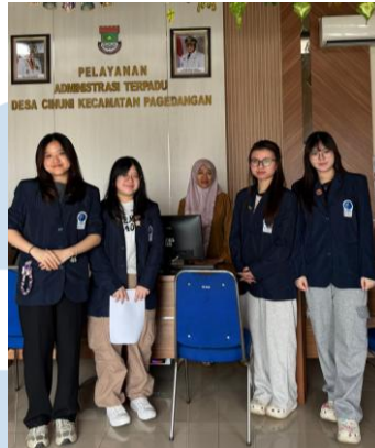
Gambar 2.1 Foto Dokumentasi di Kantor Desa Cihuni

Sementara itu, berdasarkan hasil wawancara dan data yang diperoleh dari Kantor Desa Cihuni yang dilakukan pada Senin, 2 Maret 2026, Kelurahan Medang merupakan kawasan perkotaan modern (urban hub) yang juga berlokasi di Kecamatan Pagedangan, namun dengan jumlah penduduk yang lebih padat, yaitu mencapai 27.322 jiwa. Kelurahan Medang ini berbatasan dengan Desa Curug Sangereng di wilayah utara, Desa Cijantra di wilayah selatan, Kelurahan Bojong Nangka di wilayah barat, serta Desa Cihuni di wilayah timur. Mayoritas masyarakat yang tinggal di Kelurahan Medang bekerja sebagai karyawan swasta, hal ini sejalan dengan karakter wilayah yang berkembang sebagai kawasan hunian dan pusat aktivitas ekonomi modern yang terjadi di wilayah Gading Serpong.