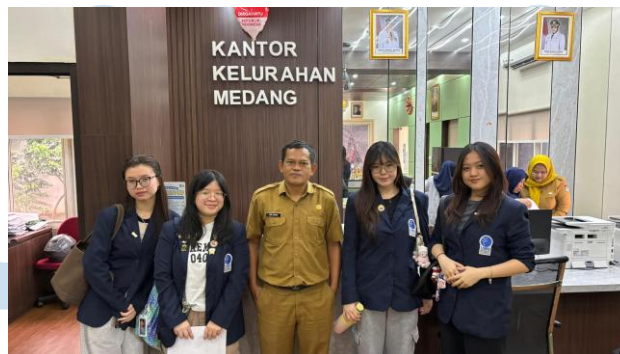
Gambar 2.2 Foto Dokumentasi di Kantor Kelurahan Medang

Sementara itu, berdasarkan hasil wawancara dan data yang diperoleh dari Kantor Desa Cihuni yang dilakukan pada Senin, 2 Maret 2026, Kelurahan Medang merupakan kawasan perkotaan modern (urban hub) yang juga berlokasi di Kecamatan Pagedangan, namun dengan jumlah penduduk yang lebih padat, yaitu mencapai 27.322 jiwa. Kelurahan Medang ini berbatasan dengan Desa Curug Sangereng di wilayah utara, Desa Cijantra di wilayah selatan, Kelurahan Bojong Nangka di wilayah barat, serta Desa Cihuni di wilayah timur. Mayoritas masyarakat yang tinggal di Kelurahan Medang bekerja sebagai karyawan swasta, hal ini sejalan dengan karakter wilayah yang berkembang sebagai kawasan hunian dan pusat aktivitas ekonomi modern yang terjadi di wilayah Gading Serpong.