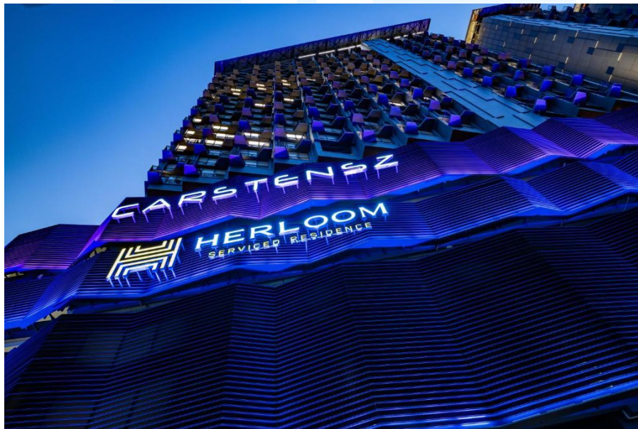
Gambar 2. 4 Penampakan Hotel & Residence Herloom BSD

Konsep utama yang diusung oleh Herloom BSD adalah “ Welcome Home ”, yaitu menghadirkan pengalaman menginap yang nyaman, hangat, dan fleksibel seperti berada di rumah sendiri. Untuk mendukung konsep tersebut, Herloom BSD menyediakan berbagai tipe kamar dan apartemen yang dilengkapi fasilitas modern seperti living room, kitchen set, restoran, area rekreasi, fitness center, kolam renang, hingga fasilitas penunjang lainnya yang dapat digunakan untuk kebutuhan jangka pendek maupun jangka panjang.