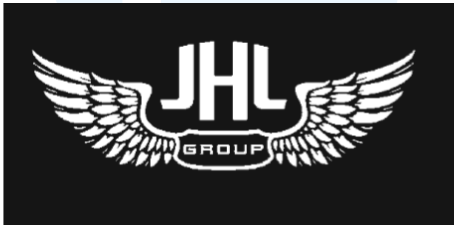
Gambar 2. 1 Logo Perusahaan JHL Group