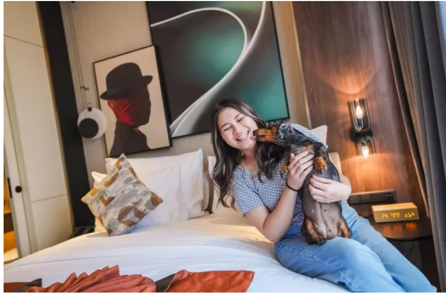
Gambar 2. 5 Potret Tamu Yang Merasakan Service Pet Friendly

Melalui pengembangan Herloom BSD, JHL Collection menunjukkan komitmennya untuk terus memperluas bisnis hospitality premium di Indonesia. Kehadiran Herloom BSD tidak hanya menjadi bagian dari ekspansi bisnis perusahaan, tetapi juga menjadi bentuk inovasi dalam menghadirkan konsep akomodasi modern yang mengutamakan kenyamanan, fleksibilitas, dan pengalaman pelanggan. Dengan dukungan JHL Group sebagai perusahaan induk serta pengalaman JHL Collection dalam industri hospitality, Herloom BSD diharapkan mampu menjadi salah satu residence unggulan di kawasan BSD dan sekitarnya.