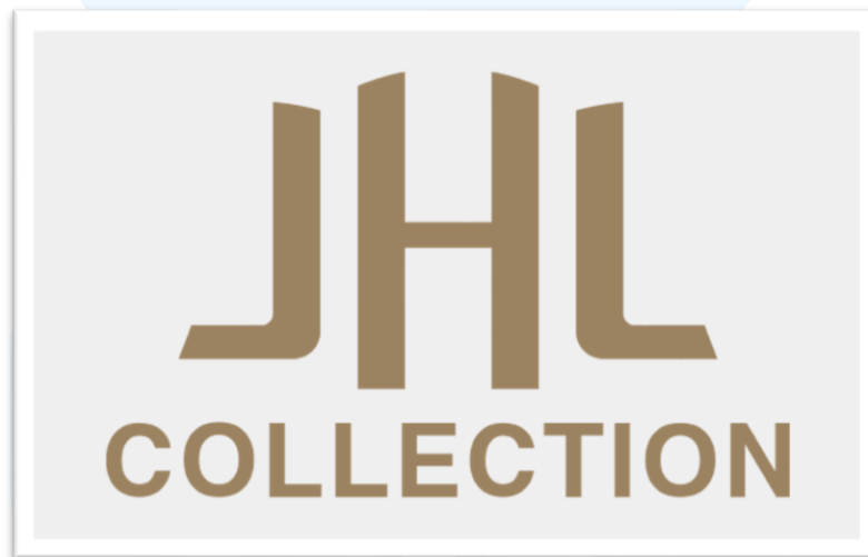
Gambar 2. 2 Logo Perusahaan JHL Collections

Salah satu sektor yang menjadi fokus utama pengembangan JHL Group adalah industri hospitality dan perhotelan. Melihat perkembangan industri pariwisata dan meningkatnya kebutuhan masyarakat terhadap akomodasi modern dan premium, JHL Group kemudian membentuk JHL Collection pada tahun 2020 sebagai unit bisnis yang bergerak pada bidang manajemen hotel dan hospitality premium. Kehadiran JHL Collection menjadi bentuk keseriusan perusahaan dalam memperluas bisnis hospitality di Indonesia, khususnya pada segmen premium hotel, resort, dan residence.