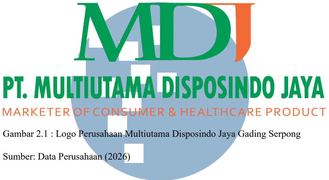
Gambar 2.1 : Logo Perusahaan Multiutama Disposindo Jaya Gading Serpong