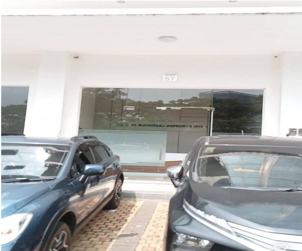
Gambar 2.2: Kantor PT. Multiutama Disposindo Jaya