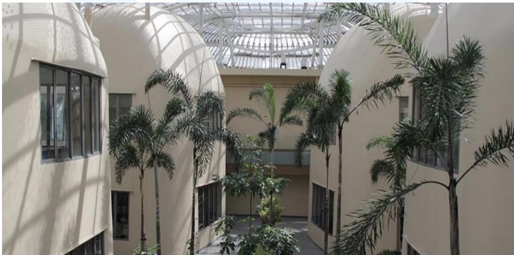
Gambar 2.2 Gedung C Lantai 12

Dalam perkembangannya, Skystar Ventures tidak hanya berperan sebagai tempat pengembangan bisnis, tetapi juga menjadi penghubung antara dunia akademik dengan dunia industri. Melalui berbagai program kewirausahaan yang diselenggarakan, mahasiswa Universitas Multimedia Nusantara diberikan kesempatan untuk memperoleh pengalaman praktis dalam membangun dan mengelola bisnis secara langsung. Hal tersebut menjadi salah satu bentuk implementasi pembelajaran berbasis praktik yang bertujuan untuk meningkatkan kompetensi mahasiswa, baik dari segi kemampuan bisnis, inovasi, maupun pengembangan soft skills.