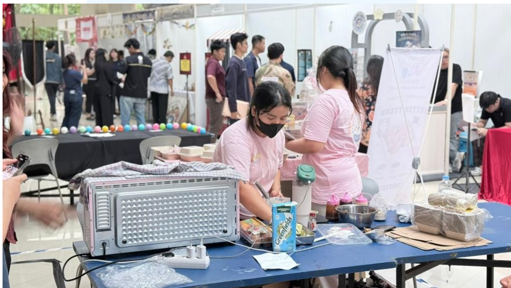
Gambar 2.3 Kegiatan Inkubasi Bisnis

Skystar Ventures merupakan sebuah lembaga inkubator bisnis yang berada di bawah naungan Universitas Multimedia Nusantara (UMN) dan didukung oleh Kompas Gramedia Group. Lembaga ini bergerak di bidang pengembangan kewirausahaan dan startup dengan menyediakan berbagai program serta fasilitas yang ditujukan untuk membantu pelaku usaha rintisan, khususnya mahasiswa dan startup tahap awal ( early-stage startup ), dalam mengembangkan bisnis mereka.