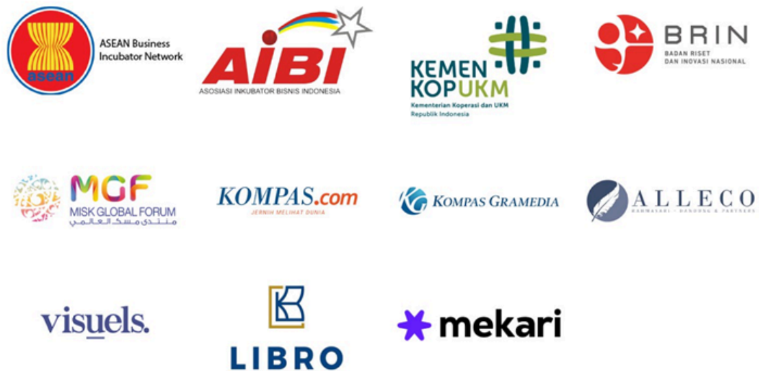
(Gambar 2.2 Mitra Skystar Ventures)