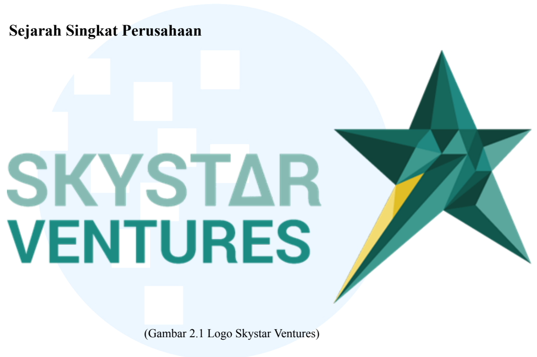
(Gambar 2.1 Logo Skystar Ventures)

Skystar Ventures merupakan sebuah lembaga inkubator bisnis teknologi serta penyedia ruang kerja bersama ( coworking space ) yang diinisiasi oleh Universitas Multimedia Nusantara (UMN) melalui kemitraan strategis bersama Kompas Gramedia Group (KGG) yang resmi berjalan sejak tahun 2014. Lembaga ini didirikan dengan fokus utama untuk memberikan pendampingan dan akselerasi bagi perusahaan rintisan ( startup ) pada fase awal ( early-stage ) yang bergerak di berbagai sektor digital maupun konvensional. Bidang-bidang yang didukung mencakup teknologi internet, aplikasi seluler, platform sosial, edutech, e-commerce, hingga inovasi industri kreatif yang berpotensi memberikan kontribusi nyata bagi kemajuan ekonomi digital di Indonesia.