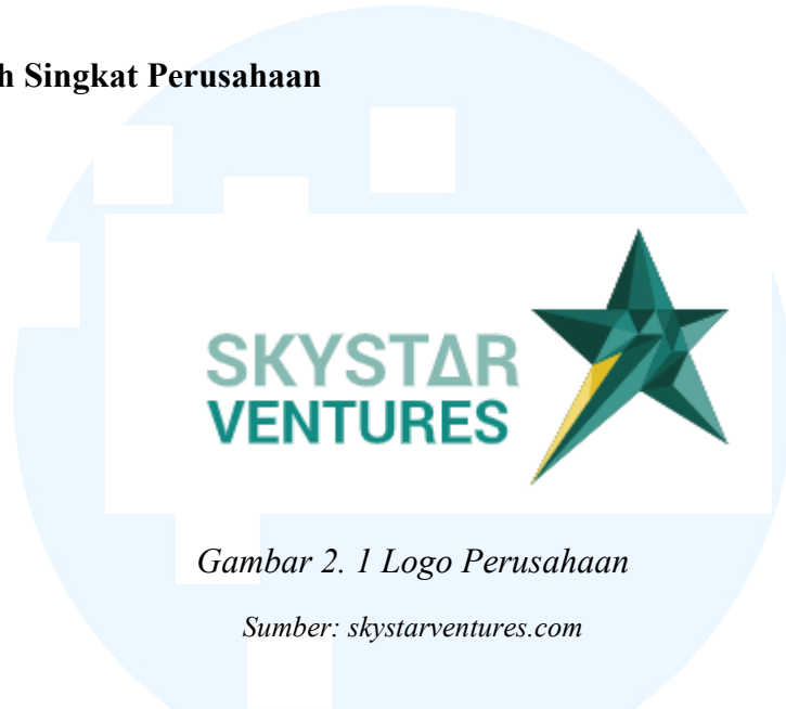
Gambar 2. 1 Logo Perusahaan