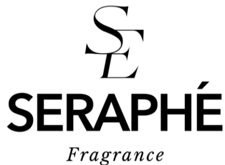
Gambar 2. 3 Logo Seraphe