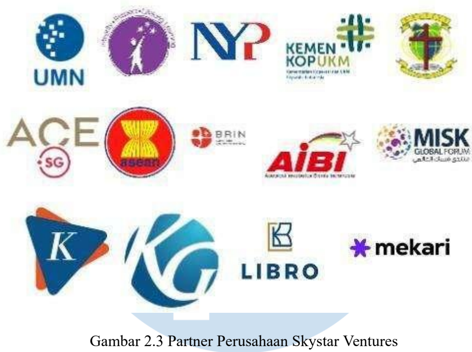
Gambar 2.3 Partner Perusahaan Skystar Ventures