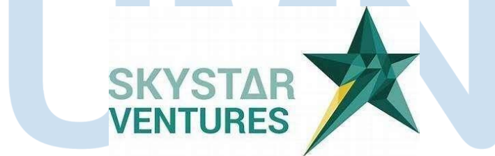
Gambar 2.1 Logo Skystar Ventures

PT Skystar Ventures adalah sebuah inisiatif yang mengintegrasikan pendidikan dan industri, didirikan pada tahun 2013. Perusahaan ini merupakan hasil dari kolaborasi strategis antara Universitas Multimedia Nusantara (UMN) dan Kompas Gramedia Group (KGG). Sebagai tempat inkubasi teknologi dan ruang kerja kolaboratif, Skystar Ventures berfokus pada pengembangan startup tahap awal di berbagai sektor digital, termasuk internet, mobile, sosial, pendidikan, dan e-commerce. Langkah ini mencerminkan komitmen yang kuat dari Skystar Ventures dalam mendukung pertumbuhan ekosistem startup di tingkat nasional. Dedikasi ini telah mendapatkan pengakuan resmi dari pemerintah, khususnya Kementerian Riset, Teknologi, dan Pendidikan Tinggi. Penghargaan tersebut diterima pada Forum Nasional Inkubator Bisnis Teknologi yang diadakan pada 3 Desember 2018 di Hotel Ayana Midplaza, Jakarta. Saat ini, Skystar Ventures menjalankan tiga program unggulan yang sejalan dengan visi dan misinya, yaitu Incubator Program , Skystar Innovation Challenge , dan Skystar Level-Up Program .