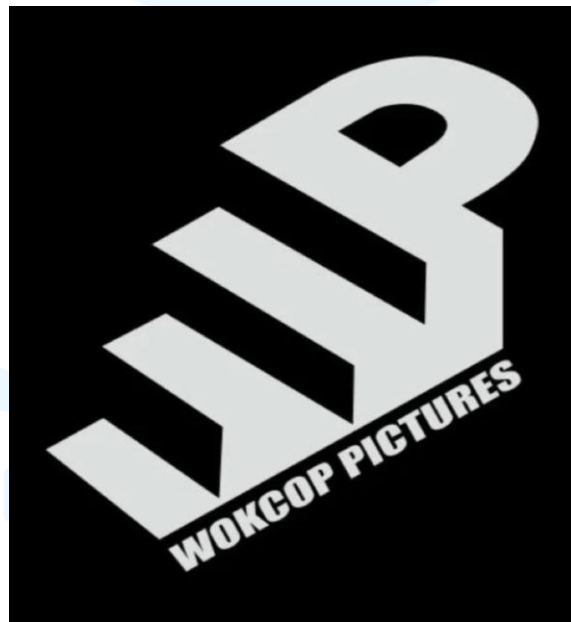
Gambar 2.1 Logo Wokcop Pictures

Wokcop Pictures adalah sebuah perusahaan rumah produksi di Tangerang Selatan yang telah berdiri sejak tahun 2019. Wokcop Pictures didirikan oleh Franklin Darmadi dan telah memproduksi banyak TVC ( Television Video Commercials ), DVC ( Digital Video Commercials ), serta beberapa film panjang. Beberapa brand yang sudah pernah dikerjakan oleh Wokcop Pictures meliputi, Mito, Victoria Care Indonesia (VCI), Unilever, Kratingdaeng, Cap Panda, Yava, dan lainnya. Di beberapa tahun terakhir, Wokcop Pictures mulai mengerjakan film panjang dengan tujuan untuk menjangkau pasar yang lebih luas dan memperkenalkan karya-karya orisinal dari Wokcop Pictures. Beberapa film yang telah digarap oleh Wokcop Pictures meliputi, Sirep dan Maju: Jejak Pahit si Kembang Gula (Endrian, 2026).