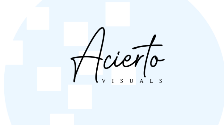
Gambar 2.1.1 Logo Acierto Visuals.

Sensory Land Kids Indonesia manifesto, Valorant digital ads, Tinggal (Original Soundtrack ‘Tinggal Meninggal’) – Mawar de Jongh music video, Sarinah social media content, dan banyak projek lainnya. Berikut tertera logo dari production house Acierto Visuals pada Gambar 2.1.1.