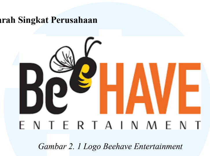
Gambar 2. 1 Logo Beehave Entertainment