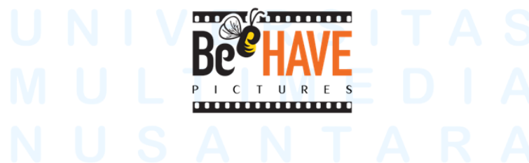
Gambar 2. 2 Logo Beehave Pictures

Beehave Entertainment didirikan pada tahun 2023 oleh Ronny Irawan, seorang casting director yang bekerja untuk MD Pictures sebelumnya selama kurang lebih 9 tahun. Beehave Entertainment adalah induk dari lini bisnis Beehave Pictures, Beehave Musics, dan Beehave Artist Management. Kantor Beehave Pictures bertempat di Bintaro. Sampai sekarang, Beehave Pictures telah memproduksi tiga film, salah satunya adalah Air Mata di Ujung Sajadah (Mangunsong, 2023), yang berhasil meraup 3.129.216 penonton dan menjadi film drama Indonesia terlaris sepanjang masa di Malaysia.