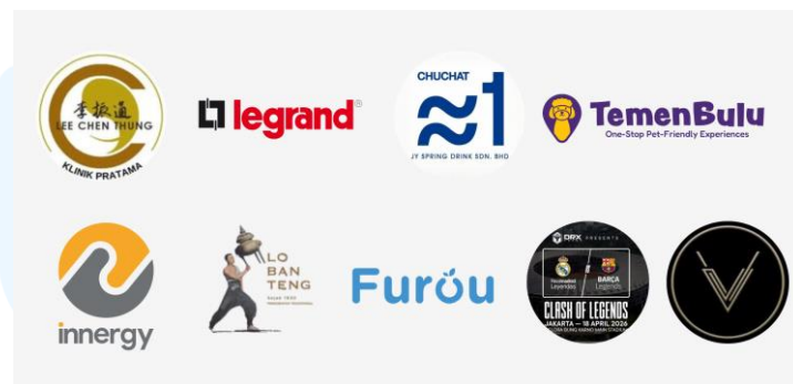
Gambar 2.2. Klien JEI Creative

Representasi dari komitmen tersebut juga tercermin dalam pemilihan nama JEI yang merupakan akronim dari Journey of Engagement and Ideas . Nama ini mencerminkan perjalanan perusahaan dalam menyertai setiap brand untuk membangun hubungan dengan audiens melalui ide-ide yang segar dan inovatif. Untuk mewujudkan perjalanan tersebut, JEI Creative didukung oleh tim internal yang terdiri dari tujuh personel inti, yang meliputi jajaran Founder dan Co-Founder , serta didukung oleh tenaga profesional di bidang Editor , Graphic Designer , dan Intern Creative . Struktur tim yang ramping namun solid ini memungkinkan JEI Creative untuk tetap lincah dalam merespons kebutuhan pasar yang berubah-ubah.