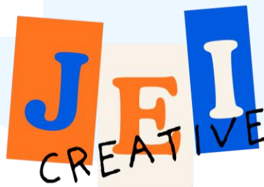
Gambar 2.1. Logo JEI Creative

JEI Creative merupakan sebuah agensi kreatif yang berdedikasi dalam bidang pemasaran digital melalui pengembangan strategi dan eksekusi konten yang orisinal serta kompetitif. Sebagai agensi startup , JEI Creative hadir untuk membantu berbagai brand meningkatkan engagement melalui strategi yang terkurasi secara personal. Mulai dari tahap konsultasi mendalam, proses eksekusi kreatif, hingga manajemen pengunggahan konten yang sistematis.