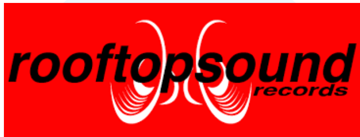
Gambar 2.1. Logo Rooftopsound.

Rooftopsound merupakan sebuah perusahaan yang bergerak di bidang jasa post-production audio, dengan spesialisasi utama pada produksi film scoring dan pengolahan musik untuk kebutuhan audio-visual. Perusahaan ini berfokus pada penciptaan musik yang dirancang secara khusus untuk mendukung narasi visual pada film dan series . Dalam praktiknya, Rooftopsound tidak hanya berperan sebagai penyedia jasa teknis, tetapi juga sebagai mitra kreatif dalam membangun identitas audio suatu karya.