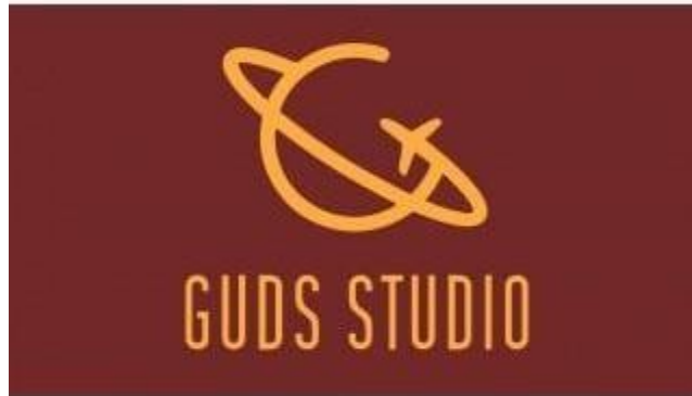
Gambar 2.1. Logo GUDS Studio

Guds Studio merupakan rumah produksi kreatif yang merupakan singkatan kata dari Giving Unexpected Developing Service . Guds Studio sendiri telah berdiri selama 9 tahun sejak 2017. Guds Studio bergerak di bidang industri kreatif, khususnya dalam produksi konten media sosial, seperti video promosi, poster, flyer, dan lainnya. Dengan tujuan untuk membantu perusahaan klien dalam membangun identitas digital yang kuat melalui konten yang kreatif, inovatif, dan relevan dengan perkembangan tren saat ini. Sejak awal, berdirinya Guds Studio sendiri berfokus pada pembuatan konten visual seperti konten instagram dan tiktok. Dengan meningkatnya peminat dan permintaan pasar media, Guds Studio terus mengalami perkembangan dengan memperluas cakupannya, tidak hanya berfokus pada produksi konten, tetapi juga meliputi penyusunan strategi konten, pengelolaan media sosial, serta proses editing secara profesional.