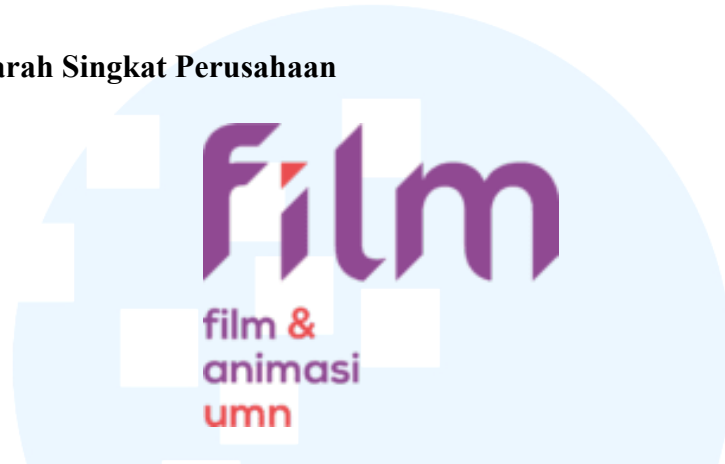
Gambar 2.1 Logo Program Studi Film.