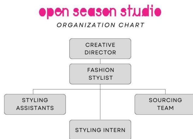
Gambar 2.3. Struktur Organisasi.

Setelahnya, terdapat asisten stylist yang membantu fashion stylist dalam mempersiapkan kebutuhan styling . Selain itu, terdapat tim sourcing yang bertanggung jawab terhadap pencarian dan pembelian kebutuhan styling sesuai dengan konsep yang telah ditentukan. Dalam struktur ini, penulis berperan sebagai styling intern yang membantu proses produksi styling , baik dalam tahap persiapan maupun saat pelaksanaan syuting berlangsung.