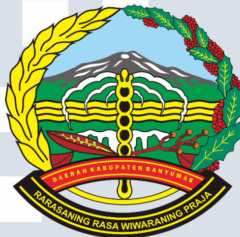
Gambar 2.1 Logo Sekretariat DPRD Kabupaten Banyumas