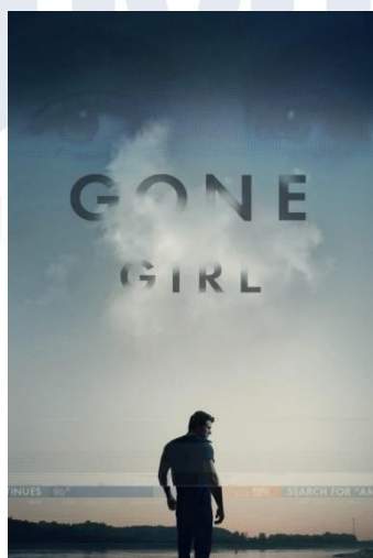
Gambar 1.1 Poster Film Gone Girl

Kini, berbagai jenis film tidak hanya ditayangkan di bioskop, tetapi juga didistribusikan melalui platform streaming agar dapat menjangkau audiens yang lebih luas. Hal ini memberi ruang bagi sineas untuk mengeksplorasi cerita yang lebih kompleks dan berani, termasuk isu-isu sosial sensitif seperti relasi gender, manipulasi psikologis, dan kekerasan dalam rumah tangga. Salah satu film yang mengangkat kisah kekerasan terhadap laki-laki merupakan Gone Girl karya David Fincher. Film ini dibintangi oleh Ben Affleck sebagai Nick Dunne dan Rosamund Pike sebagai Amy Dunne. Film Gone Girl menceritakan tentang kehidupan rumah tangga Nick dan Amy Dunne yang tampak harmonis, tetapi ternyata penuh dengan manipulasi emosional, tekanan psikologis, serta kekerasan simbolik. Melalui visual, karakter, dan dialog, film ini menampilkan bagaimana tidak hanya perempuan, melainkan laki-laki juga dapat menjadi korban kekerasan mental dan simbolik dalam lingkup rumah tangga, termasuk difitnah, dikontrol, serta dipermalukan secara publik, sehingga menghadirkan perspektif yang jarang ditampilkan tentang kekerasan domestik.