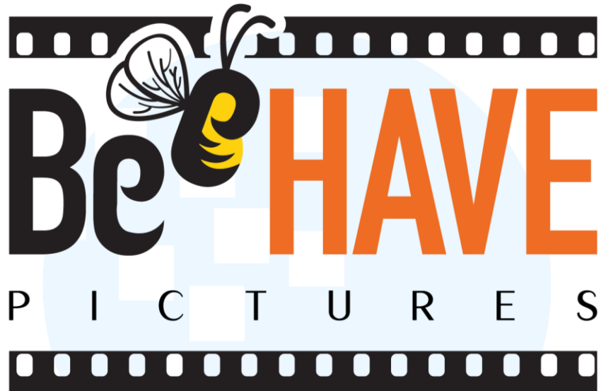
Gambar 2.2. Logo Beehave Pictures.

Dengan pengalaman di bidang entertainment selama hampir 28 tahun, Ronny Irawan mendirikan Beehave Pictures dengan sebuah misi, yaitu untuk menjadi sebuah rumah produksi yang berkomitmen untuk menghadirkan produk audio visual yang inspiratif dan sesuai dengan tujuan produksi serta target audiensnya. Dulunya terdiri dari Ronny Irawan, beberapa Road Manager , yang tugasnya mengawasi dan menemani para talent. Sekarang telah bertambah personil-personil yang mengurus keuangan, legal dan membantu dalam perihal producing . Untuk sekarang, Beehave Pictures belum memiliki pekerja lapangan in-house dan banyak bekerja sama dengan sutradara dan penulis freelance saat pembuatan film.