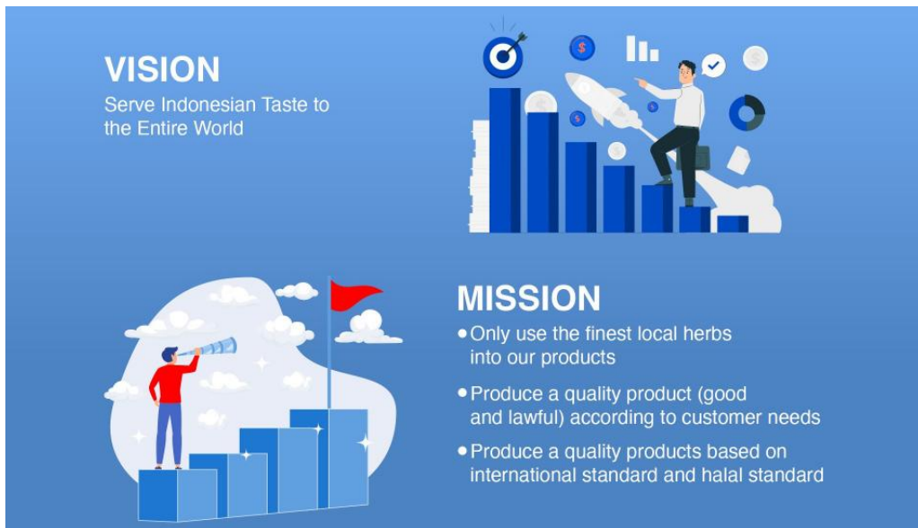
Gambar 2 2 Visi Misi PT. Jakarana Tama