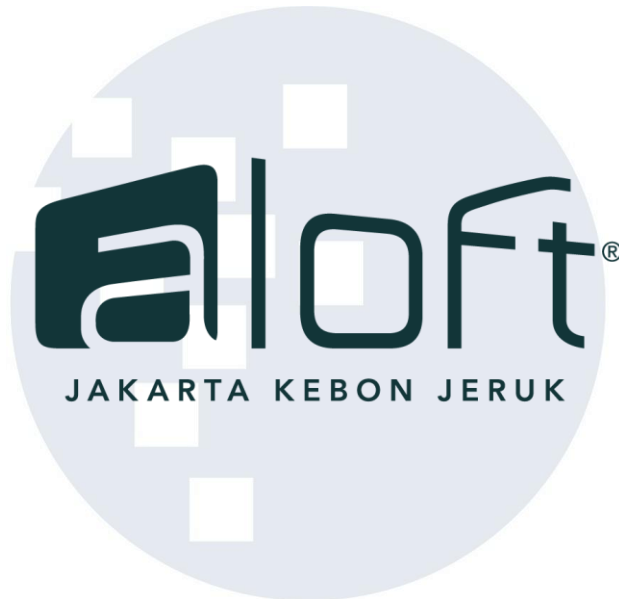
Gambar 2.1 Logo Aloft Jakarta Kebon Jeruk