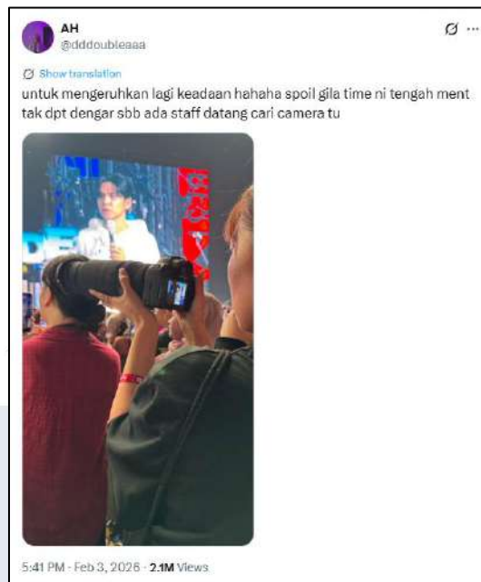
Gambar 1.2 Cuitan penggemar lokal terkait fansite dengan kamera profesional

Setelah banyak beredarnya berita tentang hal ini, dikabarkan bahwa pihak fansite sudah mengajukan permohonan maaf atas tindakan melanggar aturan yang dilakukannya pada konser DAY6 di Kuala Lumpur 31 Januari 2026 tersebut (Reyhansyah, 2026). Namun, permohonan maaf tersebut tidak membantu meredakan keadaan. Beberapa KNetz berkomentar tentang larangan membawa kamera ke dalam area konser, perilaku penduduk setempat beserta perilaku staf terhadap pihak fansite , dan merasa bahwa fansite sebenarnya tidak perlu mengajukan permohonan maaf atas tindakannya. Salah satu akun KNetz dengan username @zn5h9y memberikan kritik terhadap penggemar lokal melalui salah satu cuitannya. Melalui quote retweet , KNetz @zn5h9y menuntut penggemar lokal untuk meminta maaf kepada pihak fansite karena telah melanggar privasi orang. Pengguna @zn5h9y menganggap mereka yang mengambil gambar pihak fansite tanpa izin merupakan tindakan yang melanggar norma dan tidak menghormati budaya Korea Selatan. Pengguna tersebut menekankan bahwa konser tersebut merupakan konser band Korea Selatan, maka seharusnya penggemar lokal menghormati budaya Korea Selatan.