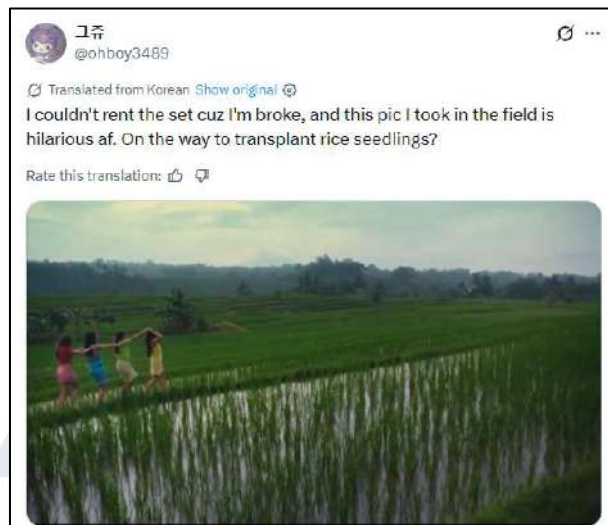
Gambar 1.5 Cuitan KNetz yang menyindir girl group No Na