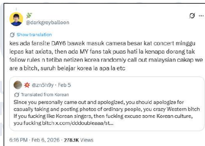
Gambar 1.4 Cuitan penggemar lokal Malaysia yang mengkritik sikap KNetz

Pernyataan tersebut mendapat respon dari beberapa pengguna X, khususnya penggemar lokal Malaysia, dan juga beberapa netizen dari Singapura dan Indonesia. Respon yang muncul terkait cuitan KNetz @zn5h9y terlihat dari pengguna dengan username @darkgreyballoon yang membalas cuitan pengguna lain yang menanyakan tentang apa yang sebenarnya terjadi. Dalam cuitan tersebut, @darkgreyballoon mengatakan bahwa penggemar lokal Malaysia merasa kecewa dengan KNetz yang tidak mengikuti aturan yang berlaku, dan justru merendahkan penggemar Malaysia. Dari cuitan tersebut, mulai terlihat bahwa interaksi yang ada tidak lagi berfokus pada isu tentang pelanggaran aturan konser, namun mulai berkembang jadi pertentangan antarkelompok. Respons yang muncul memperlihatkan bahwa ada unsur generalisasi dan sentimen negatif antara penggemar dengan latar belakang budaya dan nasional yang berbeda. Hal tersebut memicu perluasan konflik hingga ke ranah yang lebih personal.