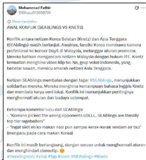
Gambar 1.7 Kesimpulan eskalasi konflik antara netizen Korea dan Asia Tenggara

Salah satu pengguna X dengan username @Ghozali13659791 mengunggah cuitan pada 14 Februari 2026 yang menjelaskan secara garis besar tentang konflik yang terjadi. Dalam cuitan tersebut, penjelasan yang diunggah oleh pengguna @Ghozali13659791 memperlihatkan bahwa konflik yang terjadi bermula dari perbedaan pemahaman karena latar belakang budaya yang berbeda, kemudian membesar hingga saling menyerang identitas kelompok tertentu. Respons yang muncul terkait konflik yang mulai menyerang identitas kelompok dari masing-masing identitas juga beragam. Respons netizen dari Asia Tenggara tidak hanya mempertahankan identitas kelompok saja, namun mereka menggunakan prestasi talenta yang diakui secara global untuk membalas ujaran kebencian yang disampaikan oleh pihak KNetz (Suara.com, 2026). Menanggapi konflik yang sedang terjadi, netizen dari Indonesia justru membalas amarah dari kelompok KNetz dengan menggunakan humor dan juga meme untuk menyindir kelompok KNetz (Suara.com, 2026).