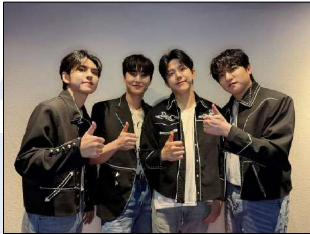
Gambar 1.1 Anggota band DAY6 asal Korea Selatan

konser yang dilakukan oleh band populer juga menarik perhatian fansite untuk hadir dalam konser tersebut. Fansite merupakan istilah yang digunakan untuk menyebut sebuah akun yang dikelola oleh penggemar K-Pop dan berfokus pada pengambilan serta penyebaran foto maupun video idol K-Pop di berbagai aktivitas, seperti konser, acara publik, serta penampilan lainnya (Kumparan.com, 2023).