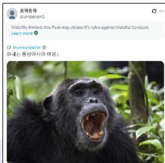
Gambar 1.6 Cuitan yang mendiskriminasi perempuan Asia Tenggara

Munculnya cuitan-cuitan bernada negatif yang menyasar para penggemar Asia Tenggara membuat konflik yang berlangsung semakin keruh. Konflik tidak lagi sebatas mempertahankan martabat identitas kelompok, namun mulai memanas hingga pertentangan yang mulai mengarah pada hal rasis dan diskriminatif. Konflik antara KNetz dengan SEAbings yang awalnya hanya perbedaan pendapat tentang aturan konser, mulai memanas dengan kedua belah pihak saling melontarkan ujaran yang merendahkan kelompok lain untuk mempertahankan identitas kelompoknya. Bentuk ujaran bernada merendahkan pada konflik ini tidak hanya ditujukan pada individu ataupun akun tertentu saja, namun juga menyerang identitas kolektif yang melekat pada kelompok tersebut. Dalam konflik ini, ujaran kebencian tidak lagi hanya dalam bentuk tanggapan untuk membalas suatu pengguna yang melontarkan ujaran kebencian saja, namun mulai membesar hingga menyerang identitas kelompok tertentu secara keseluruhan.