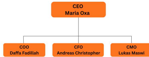
Gambar 2. 5 Bagan Struktur Organisasi Regu Pangan.

Berdasarkan bagan pada gambar 2.5, Penulis menempati posisi sebagai Chief Operating Officer (COO) dengan tanggung jawab utama merancang sistem operasional, mengawasi kualitas layanan, serta memastikan seluruh aktivitas bisnis berjalan secara efektif dan efisien. . Pada tingkat tertinggi terdapat Chief Executive Officer (CEO) yang bertanggung jawab dalam pengambilan keputusan strategis perusahaan, mengarahkan tim sesuai visi dan misi bisnis, serta membangun relasi dengan pihak luar seperti mitra dan investor untuk mensupport keberlanjutan usaha. Selain itu, terdapat posisi Chief Financial Officer (CFO) dan Chief Marketing Officer (CMO) yang memiliki kedudukan setara dengan COO.