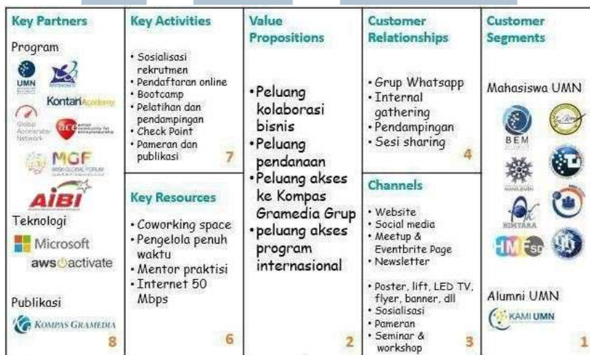
Gambar 2. 2 Business Model Canvas Skystar Ventures.

Skystar Ventures telah membantu lahirnya banyak startup dan brand dari berbagai sektor. Mengingat inkubator ini merupakan hasil kolaborasi dengan Kompas Gramedia, fokus utamanya banyak bergerak di bidang teknologi, media, dan solusi digital. Berikut adalah beberapa contoh startup atau brand yang pernah dikembangkan atau terlibat dalam ekosistem mereka : Antrique,Saraya,Hellopet.