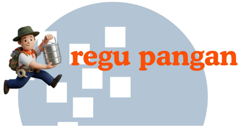
Gambar 2.3 Logo Regu Pangan.

Gramedia group. Mahasiswa juga bisa mendapat peluang akses program internasional karena Skystar bekerja sama dengan berbagai bisnis internasional.