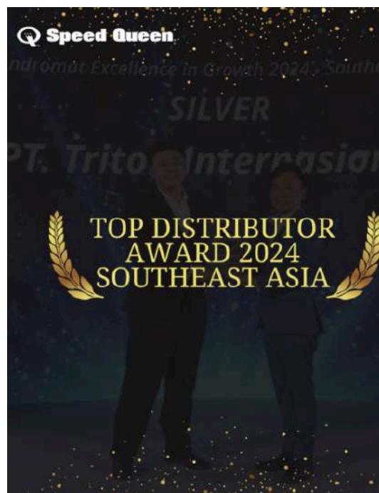
Gambar 2.13 Award PT Triton Internasional Sumber : Instagram Speed Queen

PT Triton Internasional pernah meraih penghargaan bergengsi “ Top Distributor Award 2024 Southeast Asia ” dari Alliance Laundry System . Pencapaian ini menunjukkan komitmen perusahaan dalam menghadirkan produk dan layanan berkualitas tinggi, serta keberhasilannya dalam membangun kepercayaan mitra bisnis. Penghargaan tersebut juga memperkuat posisi PT Triton Internasional sebagai salah satu distributor terkemuka di Industri laundry, sekaligus menjadi bukti bahwa strategi pemasaran dan komunikasi yang diterapkan perusahaan telah berjalan secara efektif dan berkontribusi terhadap peningkatan kinerja bisnis.