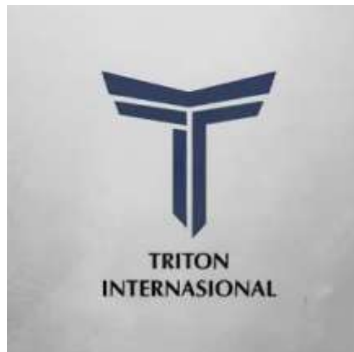
Gambar 2.1 Logo PT Triton Internasional

Penulis melaksanakan kegiatan magang di PT Triton Internasional dengan posisi Social Media Intern yang berada dibawah koordinasi divisi Marketing Communication . PT Triton Internasional, merupakan perusahaan distributor resmi mesin cuci asal Amerika Serikat di Indonesia sejak tahun 2009. PT Triton memiliki anak perusahaan yang bernama PT MLC Indonesia yang didirikan PT Triton Internasional sejak 2017. PT Triton Internasional yang merupakan distributor resmi peralatan mesin cuci Maytag sedangkan PT MLC Indonesia merupakan distributor resmi mesin cuci LG Commercial. Kedua perusahaan ini didirikan oleh Rizal Matulatan dan dikenal sebagai salah satu pelopor dalam memperkenalkan konsep Coin Laundry serta Self-Service Laundry di Indonesia. Pada tahap awal pengembangan usahanya,