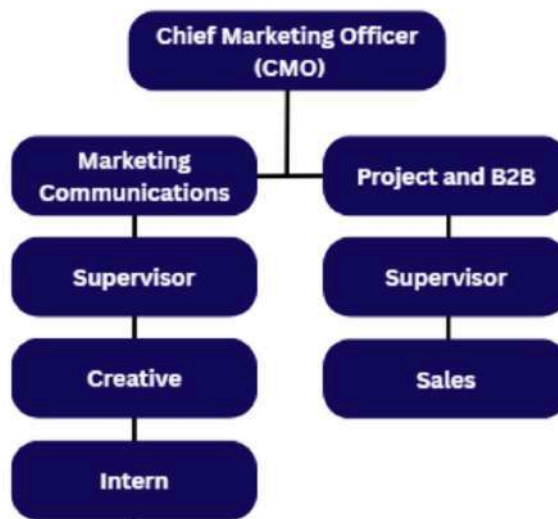
Gambar 2.12 Struktur Divisi Chief Marketing Officer (CMO)