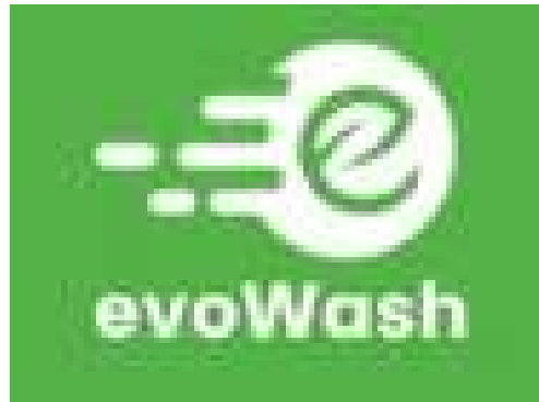
Gambar 2.7 Logo Evowash

Selain itu juga, PT Triton Internasional juga merupakan distributor mesin laundry komersial merk Maytag Indonesia yang dipasarkan melalui brand Maxpress. Melalui brand ini, perusahaan menghadirkan layanan laundry yang mencakup konsep full service maupun self service , sehingga mampu menjangkau berbagai kebutuhan pasar dengan fleksibilitas model bisnis yang ditawarkan.