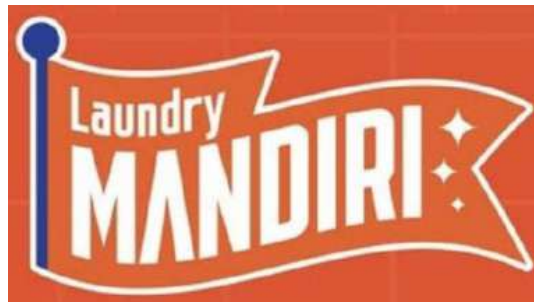
Gambar 2.5 Logo Laundry Mandiri

Selain itu, PT Triton Internasional juga memiliki unit bisnis bernama Evowash yang didirikan pada tahun 2025. Sama seperti Laundry Mandiri, Evowash mengusung konsep laundry modern dengan sistem self-service , pembayaran cashless , serta layanan operasional 24 jam yang memungkinkan pelanggan mencuci kapan saja sesuai kebutuhan mereka. Kedua unit bisnis tersebut menjadi bentuk inovasi PT Triton Internasional dalam mengikuti perkembangan gaya hidup masyarakat modern yang mengutamakan kepraktisan, teknologi digital, dan layanan yang fleksibel.