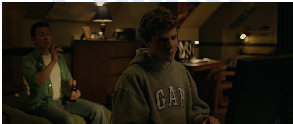
Gambar 2.2. Stills film The Social Network (2011) karya David Fincher

Cioni (dikutip dalam Restuccio, 2014) menyatakan bahwa, penggunaan teknik digital reframing dalam proses penyuntingan profesional industri film, tercatat sudah cukup sering diterapkan dalam tradisi kerja pascaproduksi industri. Contoh sutradara yang sering menggunakan teknik ini adalah David Fincher, dalam beberapa film buatannya, seperti The Social Network (2010), The Girl with the Dragon Tattoo (2011), hingga Gone Girl (2014), Fincher kerap menggunakan jasa Light Iron sebagai perusahaan pascaproduksi untuk menangani film-film buatannya. Light Iron menyatakan bahwa sejak The Social Network (2010), David Fincher memungkinkan tim penyuntingan untuk melakukan reframing , pemotongan frame dan stabilization dengan menggunakan resolusi tinggi saat shooting film, sehingga tim pascaproduksi dapat melakukan reframing dan stabilisasi dengan piksel yang cukup tanpa menurunkan kualitas gambar.