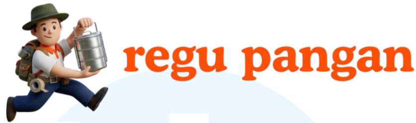
Gambar 2.3. Typeface dan Logo Regu Pangan.

Sebagai pelengkap identitas brand, Regu Pangan mengusung tagline “Partner satu regu, di medan produksi.” Tagline ini menegaskan positioning Regu Pangan sebagai mitra yang tidak hanya hadir sebagai vendor, tetapi sebagai bagian dari tim yang turut terlibat dalam dinamika produksi. Frasa “satu regu” menunjukkan kedekatan dan rasa kebersamaan, sementara “medan produksi” merepresentasikan kondisi kerja yang dinamis dan penuh tantangan. Melalui tagline ini, Regu Pangan ingin menegaskan komitmennya dalam memberikan dukungan yang menyeluruh agar kru produksi dapat bekerja dengan lebih nyaman, terorganisir, dan optimal.