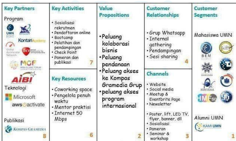
Gambar 2.2. Business Model Canvas Skystar Ventures.

Visi dan misi Skystar Ventures berfokus pada penguatan ekosistem kewirausahaan teknologi nasional melalui pemberdayaan startup tahap awal dalam proses pengembangan bisnis mereka. Komitmen ini direalisasikan melalui skema pendampingan holistik yang mencakup pelatihan intensif, mentoring, serta penyediaan akses strategis ke sumber pendanaan dan jejaring bisnis profesional. Selain dukungan intelektual, Skystar Ventures memfasilitasi operasional startup melalui penyediaan coworking space sebagai ruang kolaborasi sekaligus menjadi jembatan penghubung dengan ekosistem luas Kompas Gramedia serta mitra industri lainnya. Seluruh rangkaian dukungan ini dirancang secara sistematis untuk memastikan bahwa setiap unit usaha binaan dapat bertumbuh secara terarah dan mampu membangun keberlanjutan bisnis di tengah dinamika pasar yang kompetitif.