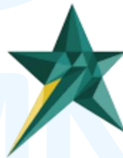
Gambar 2.1. Logo Skystar Ventures.

Dalam perjalanannya, Skystar Ventures telah mencatatkan berbagai pencapaian prestisius yang mempertegas posisinya dalam ekosistem nasional maupun internasional. Pada tahun 2015, institusi ini menjadi inkubator pertama di Indonesia yang bergabung dengan Global Accelerator Network (GAN), yang membuka akses terhadap jaringan mentor dan investor global. Reputasi tersebut diperkuat dengan perolehan akreditasi “A” dari Kemenristekdikti dan Asosiasi Inkubator Bisnis Indonesia (AIBI) pada tahun 2019, menjadikannya satu-satunya