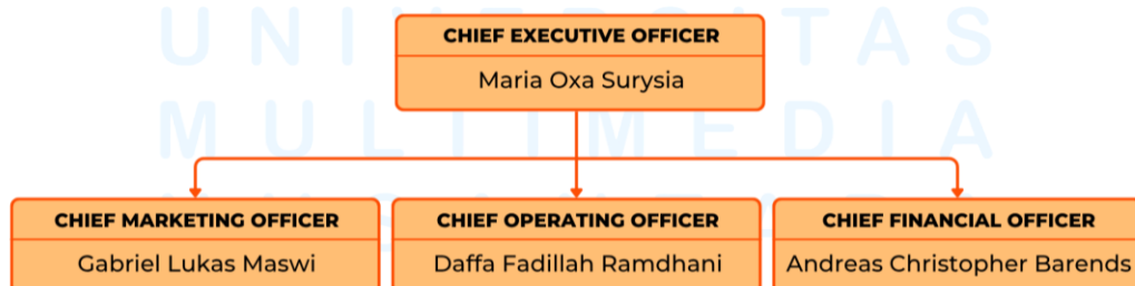
Gambar 2.5. Bagan Struktur Organisasi Regu Pangan.

Meskipun memiliki pembagian peran yang spesifik, struktur ini tetap menekankan kolaborasi yang erat antar fungsi, di mana setiap posisi tidak hanya bekerja secara terpisah, tetapi juga saling terintegrasi dalam proses pengambilan keputusan. Pendekatan ini memungkinkan Regu Pangan untuk bergerak secara adaptif dalam merespons dinamika kebutuhan produksi film yang cepat dan dinamis. Dengan struktur organisasi yang ringkas namun strategis ini, Regu Pangan diharapkan mampu mengoptimalkan kinerja tim sekaligus memastikan terciptanya layanan yang efektif, efisien, dan berdampak positif terhadap kenyamanan serta produktivitas kru produksi.