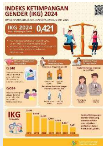
Gambar 1. 1 Indeks Ketimpangan Gender (IKG) Indonesia