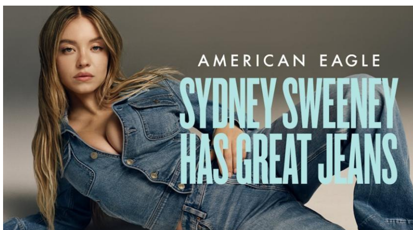
Gambar 1.1. Iklan American Eagle “Sydney Sweeney Has Great Jeans”