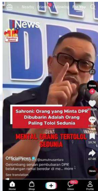
Gambar 1.4 Konten Komentar Kontroversial