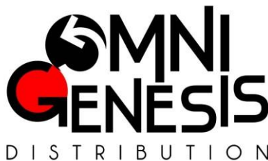
gambar 2.1 Logo PT. Omni Genesis Distribution

Menghadirkan game dan barang koleksi berkualitas tinggi melalui distribusi, retail dan keterlibatan terhadap komunitas yang efisien.