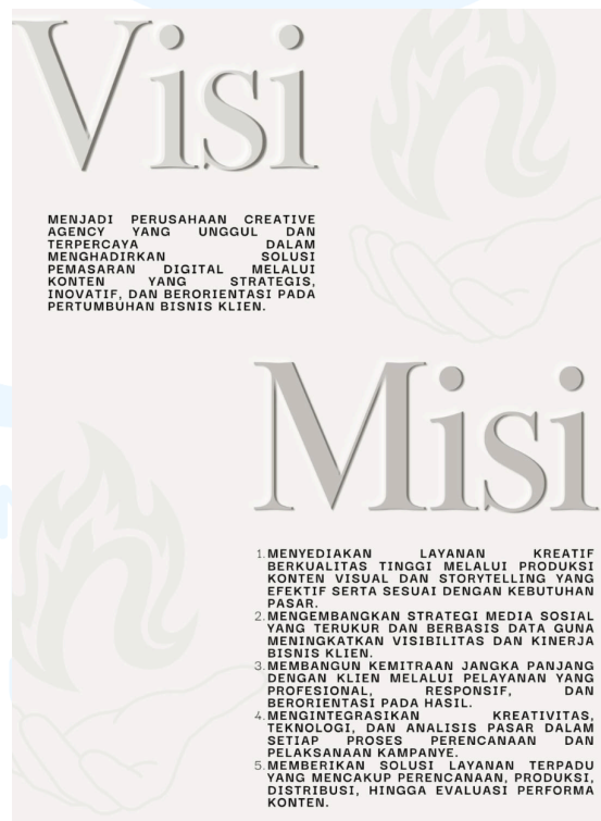
Gambar 2.1 visi misi neokarsa.

Neokarsa Agency merupakan sebuah creative agency yang bergerak di bidang pemasaran digital dan produksi konten media sosial yang didirikan pada tahun 2025. Agency ini hadir sebagai solusi bagi pelaku usaha, khususnya UMKM, yang ingin meningkatkan performa bisnis melalui pengelolaan konten digital yang lebih strategis dan terarah. Neokarsa Agency berfokus pada pembuatan konten visual berbasis storytelling yang tidak hanya menarik secara visual, tetapi juga mampu membangun brand awareness , meningkatkan engagement , serta mendorong konversi penjualan. Target utama dari agency ini adalah bisnis yang aktif di media sosial, terutama pada sektor food and beverage (F&B) , fashion , dan hospitality yang sangat bergantung pada kekuatan visual dan tren. Dalam operasionalnya, Neokarsa Agency menawarkan layanan seperti produksi foto dan video, penyusunan strategi konten, serta perencanaan komunikasi digital yang dikemas dalam bentuk paket sesuai kebutuhan klien.