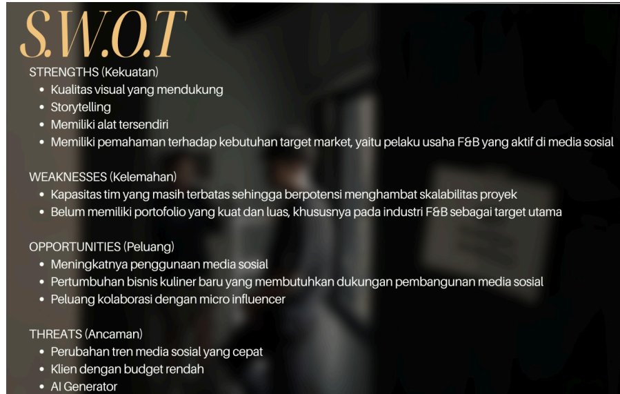
Gambar 2.3 SWOT neokarsa.

dihadapi antara lain persaingan dengan agency lain, perubahan tren media sosial yang cepat, serta perkembangan teknologi seperti AI dalam pembuatan konten.