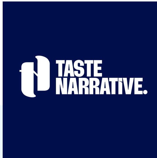
Gambar 2.1. Logo Perusahaan Taste Narrative.

Taste Narrative mengusung visi untuk membentuk ekosistem baru dalam lingkup F&B dan industri kreatif, di mana seluruh pemangku kepentingan seperti brand , komunitas, asosiasi, institusi, hingga pemerintah, dapat berkolaborasi dalam sebuah ruang yang inklusif, saling menguntungkan, dan berorientasi pada pertumbuhan jangka panjang. Sejalan dengan visi tersebut, misi Taste Narrative adalah mengangkat dan mengembangkan narasi-narasi autentik dari berbagai sektor sebagai medium untuk membangun koneksi, memperluas perspektif, serta menghadirkan inspirasi baru bagi masyarakat Indonesia, khususnya dalam industri F&B dan kreatif.