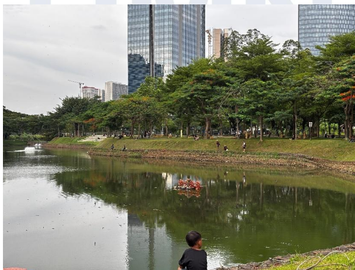
Gambar 1. 2 Penampakan Danau di Taman Downtown Lake Alam Sutera Sumber: Dokumentasi Penulis, 2026

Sebagai salah satu RTH di kawasan CBD Alam Sutera, Taman Downtown Lake Alam Sutera menghadirkan pengalaman ruang alami di tengah padatnya lanskap perkotaan. Namun, tinjauan terhadap kualitas ruang publik di taman tersebut menunjukkan adanya kekurangan dalam aspek placemaking yang digagas oleh Project for Public Spaces (PPS). Berdasarkan temuan sebelumnya, taman ini hanya berhasil memenuhi aspek kenyamanan dan citra melalui kehadiran elemen biru dan hijau alami yang jarang ditemukan pada pusat kawasan komersial. Selain aspek tersebut, Taman Downtown Lake belum memenuhi aspek lainnya. Rendahnya aspek sosiabilitas taman disebabkan oleh kurangnya keterlibatan komunitas di dalam taman, memberikan kesan eksklusif kepada pengunjung taman. Kegunaan dan aktivitas dalam taman juga tergolong rendah karena minimnya aktivasi fungsi komersial dan fasilitas penunjang lainnya, sehingga kegiatan dalam taman hanya terbatas pada rekreasi pasif dan olahraga yang sangat bergantung pada kondisi cuaca. Keberadaan pedagang informal di area taman menjadi salah satu tanda adanya kebutuhan fasilitas komersial yang belum terakomodasi. Terakhir, pada aspek akses dan keterhubungan, Taman Downtown Lake memiliki kesan terisolasi karena kurangnya integrasi spasial dengan lingkungan sekitarnya. Menanggapi hal tersebut, salah satu peluang perancangan ada pada lahan perkantoran kosong seluas 1 hektar pada bagian timur taman.