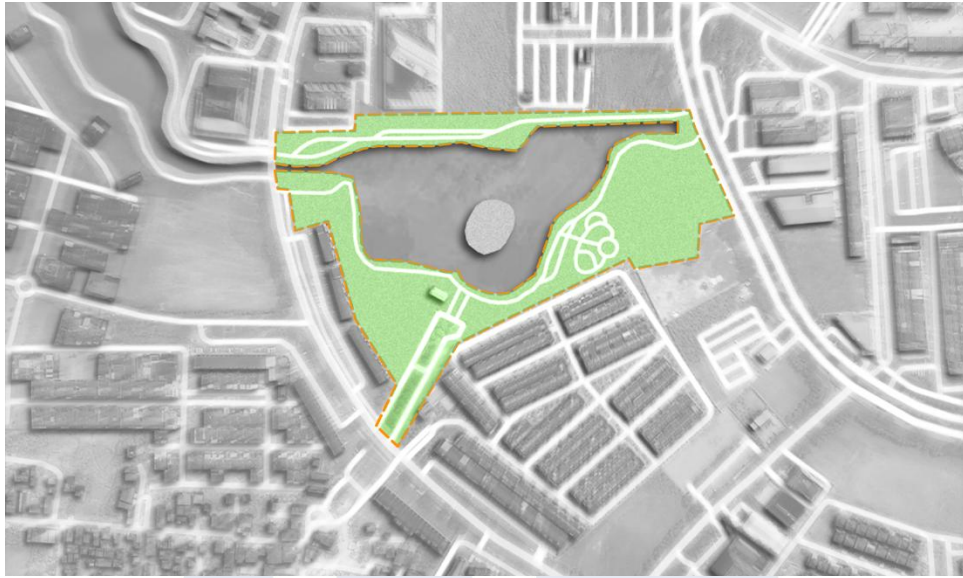
Gambar 1.3 Batasan kawasan perancangan Diagram: diolah penulis, 2026