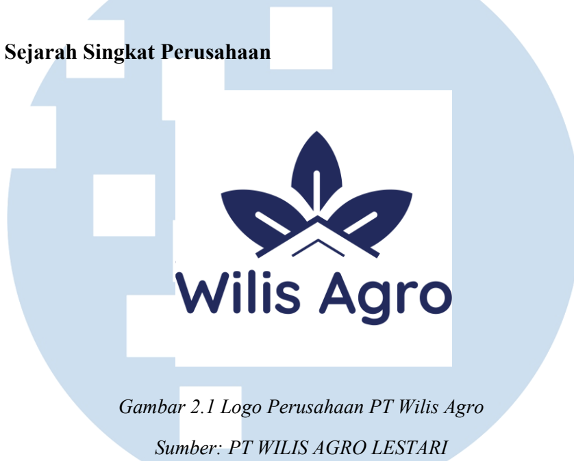
Gambar 2.1 Logo Perusahaan PT Wilis Agro