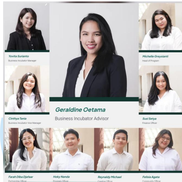
Gambar 1.2 Struktur Organisasi Skystar Ventures