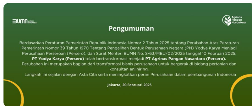
Gambar 2.3 Perubahan Status Nama PT Yodya Karya Menjadi Agrinas Pangan Nusantara

Karya sebagai BUMN. Bisnis telah bertransformasi dari sekadar alat negara menjadi badan usaha yang mampu "bertarung" dan berinovasi berkat metode kerja yang mapan. Seiring berjalannya waktu akhirnya tower PT Yodya Karya diresmikan pada tahun 2019. Kemudian pada tahun 2025 karena terjadi pengalihan perusahaan negara PT Yodya Karya beralih nama menjadi Agrinas Pangan Nusantara yang masih membawa semangat serta visi misi PT Yodya Karya (Persero) Sebelumnya. Pada tahun 2022 Agrinas Pangan Nusantara telah mempunyai 5 kantor divisi, 6 kantor wilayah serta 4 kantor cabang.