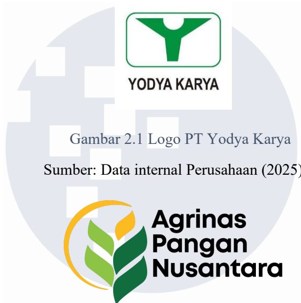
Gambar 2.1 Logo PT Yodya Karya