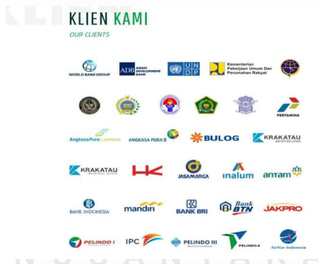
Gambar 2.5 Daftar Klien Mitra Perusahaan

kompetitif, dan memilih proyek-proyek bernilai tinggi. Pengembangan sumber daya manusia dan sistem manajemen yang berkelanjutan ditekankan untuk memastikan operasi yang terintegrasi, efisien, transparan, dan akuntabel. Perusahaan menjunjung tinggi prinsip kepemimpinan yang kuat dan berkomitmen untuk terus meningkatkan kompetensi dan kemampuan karyawan. PT Agrinas Pangan Nusantara telah menjalin kerjasama dengan beberapa klien BUMN yang mencakup berbagai sektor yang memerlukan konsultasi teknik, manajemen proyek, serta layanan pengembangan bisnis, seperti lembaga pemerintah, perusahaan swasta, dan organisasi masyarakat yang mencari layanan berbasis teknologi berkualitas tinggi secara Business to business. Model business to business Agrinas Pangan Nusantara mencakup partnership ataupun kerja sama dengan Perusahaan lain di bidang industrial seperti pengawasan proyek, Pembangunan serta pengeboran dibawah ini merupakan list kerjasama perusahaan dengan klien-klien dan juga hasil karya/jasa yang telah dilakukan perusahaan.