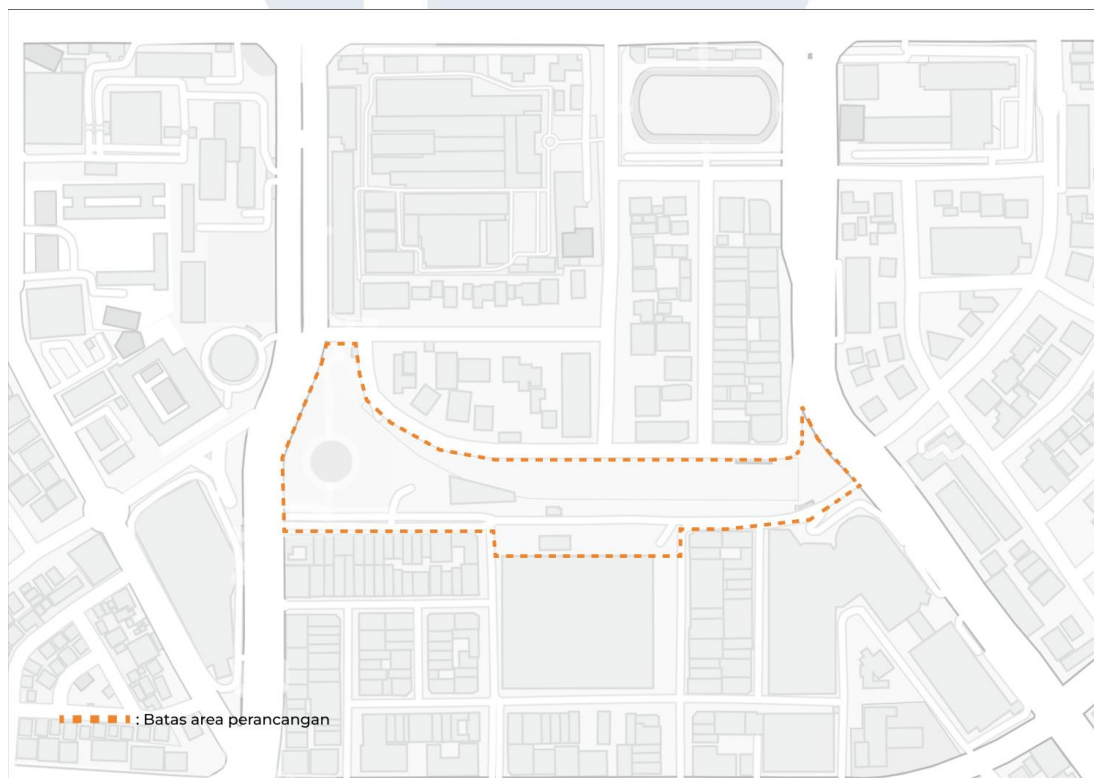
Gambar 1. 3 Batasan area perancangan

Batasan ini diperlukan guna memastikan perancangan tetap terfokus pada solusi arsitektural secara spesifik terhadap permasalahan yang telah diidentifikasi sebelumnya.