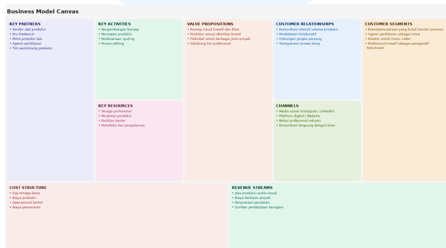
Gambar 2.2. Bagan BMC Perusahaan EDEN STUDIO