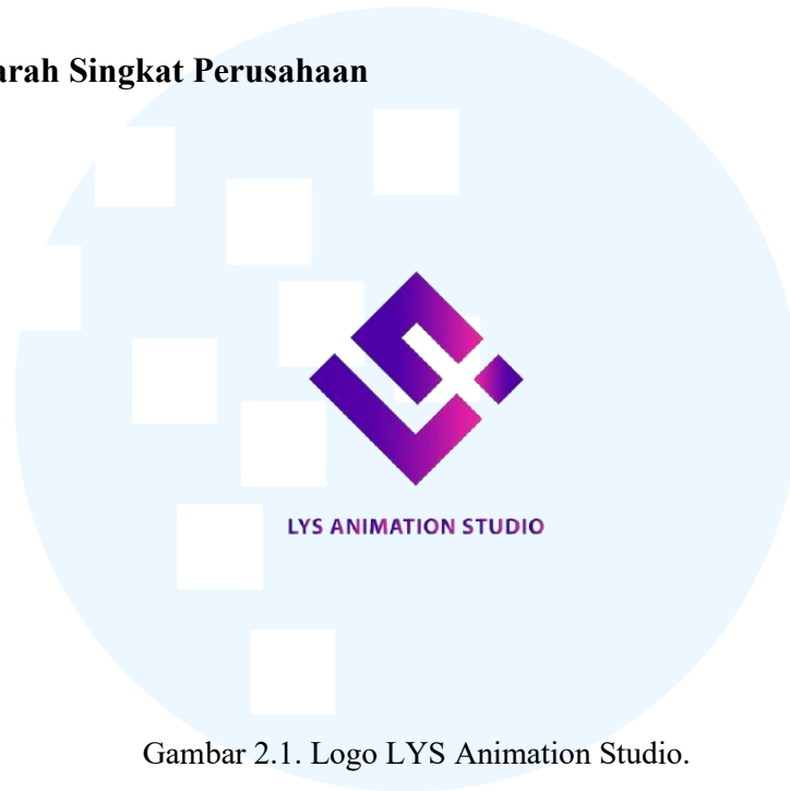
Gambar 2.1. Logo LYS Animation Studio.