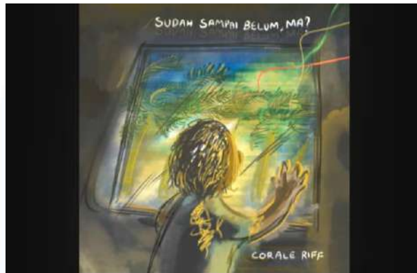
Gambar 2.10 Still Shot MV Sudah Sampai Belum, Ma? (2026)

Music Video "Sudah Sampai Belum, Ma?" menunjukkan kehidupan tiga orang yang lelah & terperangkap akan beban hidupnya masing-masing saat mereka tertarik masuk dalam dunia buku cerita fantasi. Mereka kemudian menghidupkan kembali keinginan dan masa kecil tiap orang.