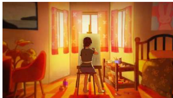
Gambar 2.6 Still Shot Hollow Tarik Garis Studio (2026)