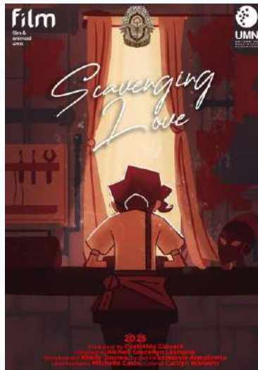
Gambar 2.7 Poster Scavenging Love The Oracles (2026)

Menceritakan mengenai seorang mekanik yang menyukai seorang penari tradisional. Ia kemudian berusaha untuk memberikan cintanya, namun terhalang keadaan ekonominya, sehingga cintanya tak dapat tersampaikan kepada sang enari. Kemudian ia bertemu dengan seorang dekorator bunga yang menerima dirinya apa adanya, yang kemudian memberikan kebahagiaan kepada sang mekanik.