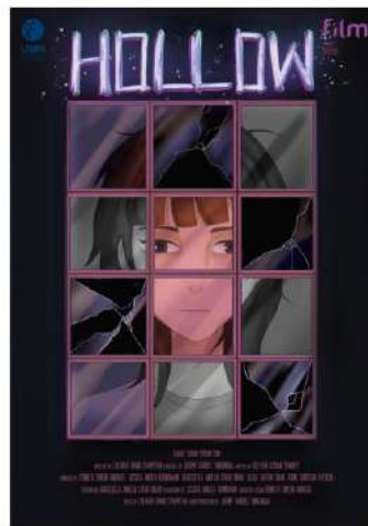
Gambar 2.6 Poster Hollow Tarik Garis Studio (2026)

Hollow menceritakan seorang anak bernama Nata yang adalah seorang keturunan Indonesia-Belanda. Bersama ayahnya, Nata menghabiskan masa kecilnya dengan melukis. Namun, ia mulai kehilangan minat melukis sejak ayahnya meninggal. Hingga suatu hari, Nata menemukan kembali semangat untuk melukisnya.