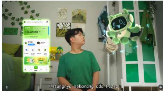
Gambar 2.10 Still Shot Iklan Fazza Swarna Sinema (2026)

Production House Swarna berkolaborasi dengan Fazza dalam sebuah iklan untuk menabung dan mengelola uang. Dengan menggabungkan animasi dan live action , iklan ini sukses menunjukkan fitur unggulan fazza yaitu fitur pocket dan bunga sebesar 9%.