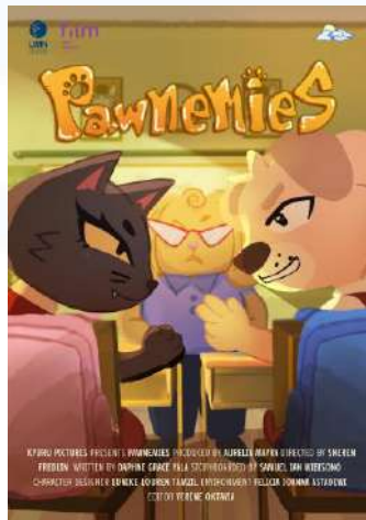
Gambar 2.3 Poster Pawnemies Kyuru Pictures (2026)

Pawnemies menceritakan seekor anjing dan kucing yang berada dalam 1 sekolah dan berkompetisi satu sama lain. Dengan mengambil latar anak-anak SD, kedua karakter digambarkan sebagaimana anak-anak bersaing sesuai umur mereka.