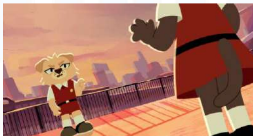
Gambar 2.4 Still Shot Pawnemies Kyuru Pictures (2026)