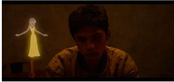
Gambar 2.9 Still Shot Alleen Rasi Pictures (2026)

Alleen menceritakan mengenai seorang pemuda yang merasa putus asa dan menyesal telah putus dari mantannya. Ia kemudian menumpahkan isi hatinya dalam sebuah lagu sambil mengenang masa-masa mereka saat bersama.