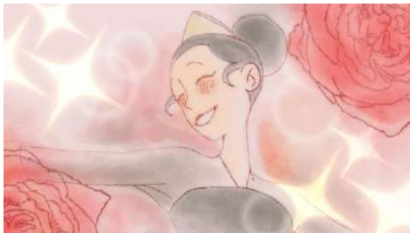
Gambar 2.8 Still Shot Scavenging Love The Oracles (2026)