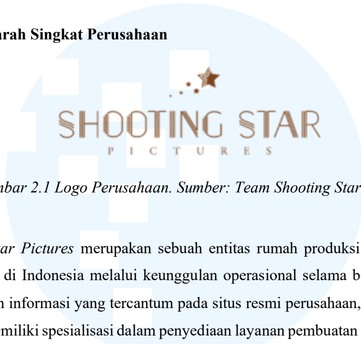
Gambar 2.1 Logo Perusahaan.

Shooting Star Pictures merupakan sebuah entitas rumah produksi kreatif dalam audiovisual di Indonesia melalui keunggulan operasional selama bertahun-tahun. Berdasarkan informasi yang tercantum pada situs resmi perusahaan, Shooting Star Pictures memiliki spesialisasi dalam penyediaan layanan pembuatan konten digital , iklan televisi, konten multimedia, motion graphic , hingga produksi Profil Perusahaan. Perusahaan ini didukung oleh tim profesional yang memiliki pengalaman kolektif selama 15 tahun di industri kreatif dan komunikasi merek.