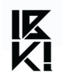
Gambar 2.1.2. Logo IBUKI Motion 2026

IBUKI Motion adalah tim produksi animasi yang dibentuk di lingkungan akademik Universitas Multimedia Nusantara sebagai bagian dari pelaksanaan program PRO-STEP, khususnya dalam skema Road to Championship. Tim ini pertama kali dibentuk pada Agustus 2025 dengan enam anggota yang saat itu masih berada di semester awal perkuliahan untuk mengerjakan proyek animasi pertama mereka berjudul “ FETCH! ” pada mata kuliah produksi animasi. Dalam proses pengerjaannya, para anggota menemukan kecocokan dalam pola kerja kolaboratif sehingga berhasil menghasilkan karya yang ikut berpartisipasi di berbagai festival serta memperoleh sejumlah nominasi. Pada semester berikutnya, anggota tim sempat terpisah ke beberapa proyek berbeda sesuai kebutuhan akademik, sebelum akhirnya kembali bergabung pada semester enam dalam