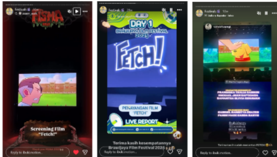
Gambar 2.3.2 Kompilasi Instagram Story penayangan “ FETCH! ” di berbagai festival film