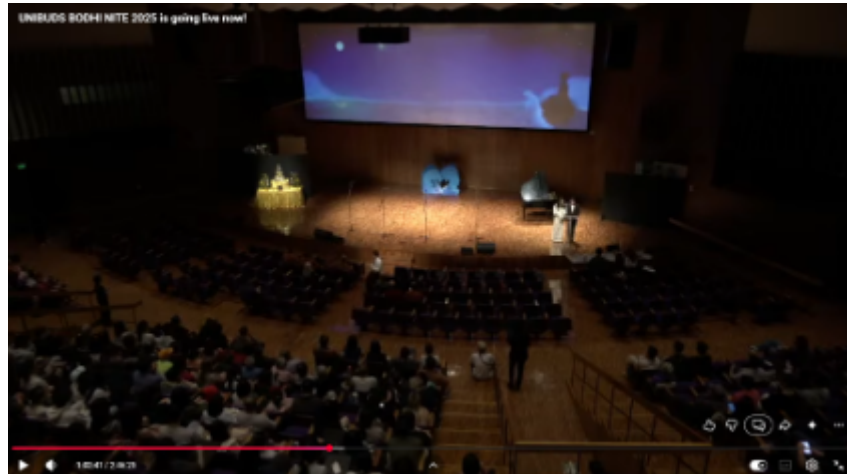
Gambar 2.3.1 Penayangan animation opening karya IBUKI Motion pada acara UNIBUDS BODHI NITE 2025 .

Selain itu, IBUKI Motion juga telah mengerjakan proyek komisi berupa animation opening untuk acara Bodhi Nite 2025 yang diselenggarakan oleh UNIBUDS . Karya ini berdurasi sekitar tiga menit dan digunakan sebagai video pembuka dalam rangkaian acara tersebut. Proyek ini menjadi pengalaman tim dalam mengerjakan karya berbasis kebutuhan dengan pendekatan visual yang komunikatif dan sesuai dengan konteks acara.