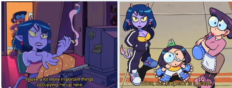
Gambar 1. 1 Shot PUNCH PUNCH FOREVER - Pilot

khususnya pada gaya animasi, timing aksi, ekspresi karakter, serta dinamika gerak yang energik. Selain itu, episode “ The Ollie ” dari seri The Amazing World of Gumball (Cartoon Network, 2017) juga digunakan sebagai referensi tambahan dalam membangun ritme komedi dan pacing visual yang dinamis. Episode tersebut menampilkan sekuen skateboarding dengan gaya visual eksperimental yang menghadirkan pergerakan ekspresif dan cepat (Gumball Wiki, 2021).