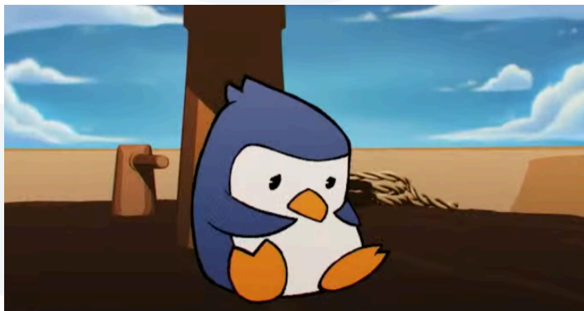
Gambar 2.7 Final Shot Animation Opening Karya IBUKI Motion Pada Acara UNIBUDS BODHI NITE 2025. Sumber: UNIBUDS, 2025, YouTube

Selain itu, IBUKI Motion telah memproduksi sebuah komisi animasi pendek untuk pembukaan acara Bodhi Nite 2025 yang diselenggarakan oleh UNIBUDS. Animasi memiliki durasi kurang lebih 3 menit yang ditayangkan sebagai bagian dari pembukaan rangkaian acara tersebut. Pengerjaan komisi animasi pendek ini menjadi pengalaman profesional yang penting bagi tim. Selain itu proyek ini