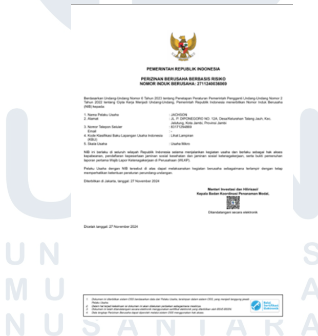
Gambar 2.2 NIB

Seiring dengan meningkatnya aktivitas bisnis dan kebutuhan legalitas usaha, 5ENT telah melakukan pengurusan Nomor Induk Berusaha (NIB) sebagai bentuk komitmen dalam menjalankan kegiatan usaha secara sah dan profesional. Langkah ini diambil karena bisnis 5ENT menunjukkan perkembangan yang signifikan, baik dari segi penjualan, kerja sama eksternal, maupun kegiatan produksi yang semakin terstruktur. Pada awalnya, 5ENT beroperasi secara informal dengan skala usaha kecil berbasis mahasiswa. Namun, seiring pertumbuhan bisnis dan meningkatnya kebutuhan untuk menjalin kolaborasi dengan mitra eksternal seperti vendor konveksi dan mitra promosi, legalitas formal menjadi hal yang penting untuk memperkuat kepercayaan dan kredibilitas usaha di mata publik.