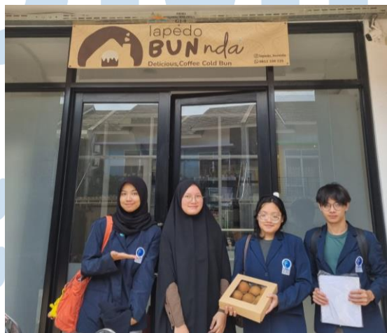
Gambar 2.1 Lokasi Toko Lapédo BUNnda

Berdasarkan data terbaru, Kelurahan Sukabakti memiliki jumlah penduduk sebanyak 19.433 jiwa yang tersebar dalam 4.438 kepala keluarga. Dari aspek pendidikan, mayoritas penduduk telah menyelesaikan pendidikan hingga jenjang SLTA/ sederajat, sementara sebagian lainnya melanjutkan pendidikan ke jenjang perguruan tinggi. Kondisi tersebut menunjukkan bahwa kualitas sumber daya manusia di Kelurahan Sukabakti cukup baik dan memiliki potensi untuk mendukung perkembangan berbagai sektor, termasuk sektor usaha mikro, kecil, dan menengah (UMKM) yang menjadi salah satu penggerak perekonomian masyarakat setempat.