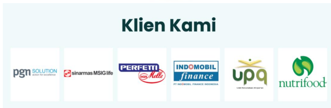
Gambar 2.8 Klien Klinik DNA Favorit