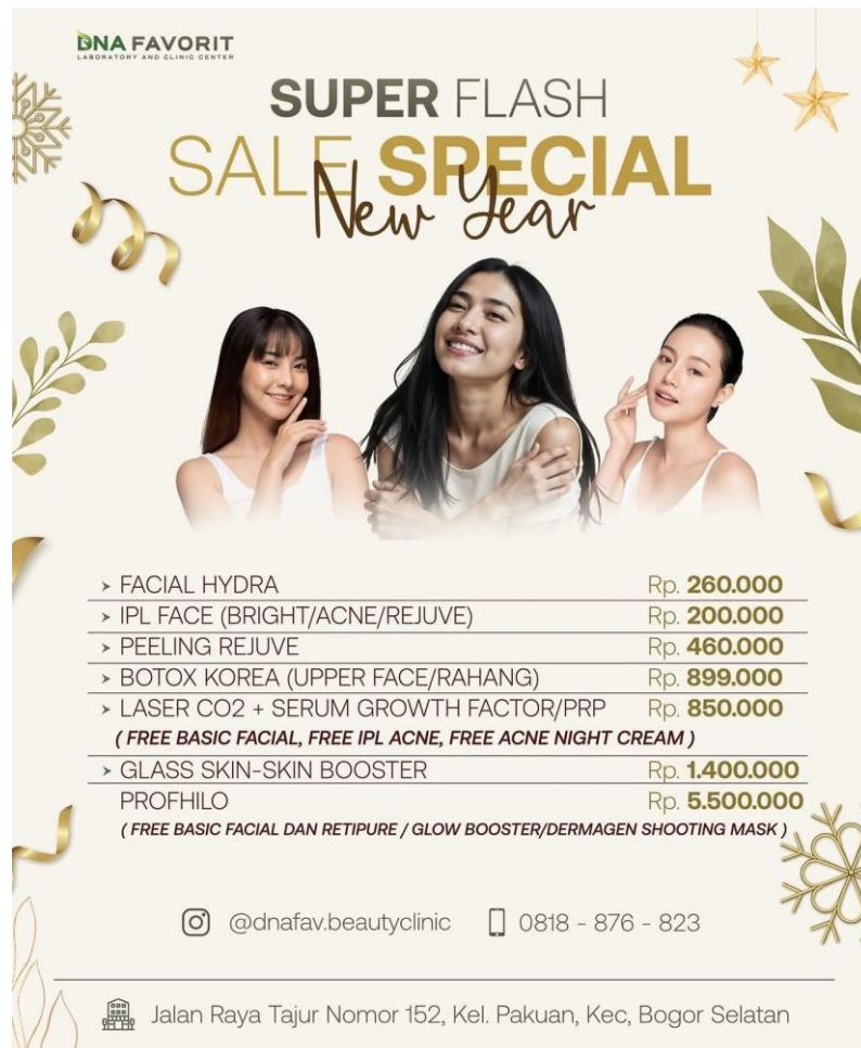
Gambar 2.11 Layanan DNA Klinik Kecantikan

Berdasarkan Gambar 2.11, DNA Klinik Kecantikan menyediakan berbagai layanan perawatan kulit dan kecantikan berbasis medis, seperti facial treatment, DNA Salmon Skin Booster, Pico Laser, dan berbagai treatment kecantikan lainnya. Layanan tersebut didukung oleh tenaga profesional serta teknologi kecantikan modern yang bertujuan membantu menjaga kesehatan dan penampilan kulit pasien secara optimal.