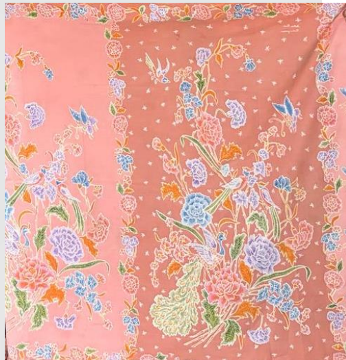
Gambar 2 1 Motif Batik Buketan Pekalongan

Buku yang berjudul “ Inclusive Innovation: Empowering Entrepreneurial Transformation Through the Art and Heritage of Batik ”(2025) menjelaskan Pekalongan yang berada di kawasan pesisir utara Pulau Jawa dikenal sebagai daerah penghasil batik dengan karakter yang modern dan kaya warna. Teknik pembuatannya meliputi batik tulis (gambar tangan) serta batik cap. Keunikan batik Pekalongan terletak pada motifnya yang banyak dipengaruhi oleh unsur alam serta budaya Tiongkok dan Belanda, seperti bentuk bunga dan ragam pola geometris. Warna yang digunakan cenderung cerah dan variatif, di antaranya merah, biru, hijau, dan kuning. Dalam proses produksinya, batik cap memiliki waktu pengerjaan yang lebih singkat karena menggunakan cap berbahan tembaga, sementara batik tulis tetap mempertahankan nilai estetika dan keunikan seni yang lebih tinggi (Kuncara et al., 2025).