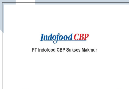
Gambar 2.1. Logo PT. Indofood CBP Sukses Makmur Tbk.

PT. Indofood CBP Sukses Makmur Tbk merupakan salah satu produsen konsumen bermerek terkemuka di Indonesia yang menyediakan berbagai pilihan produk makanan sehari-hari bagi konsumen di segala usia. Perusahaan ini secara resmi berdiri sebagai entitas terpisah pada bulan September 2009 melalui proses restrukturisasi internal dari Grup Consumer Branded Product (CBP) PT. Indofood Sukses Makmur Tbk [5]. Gambar 2.1 menunjukkan logo perusahaan PT. Indofood CBP Sukses Makmur Tbk.