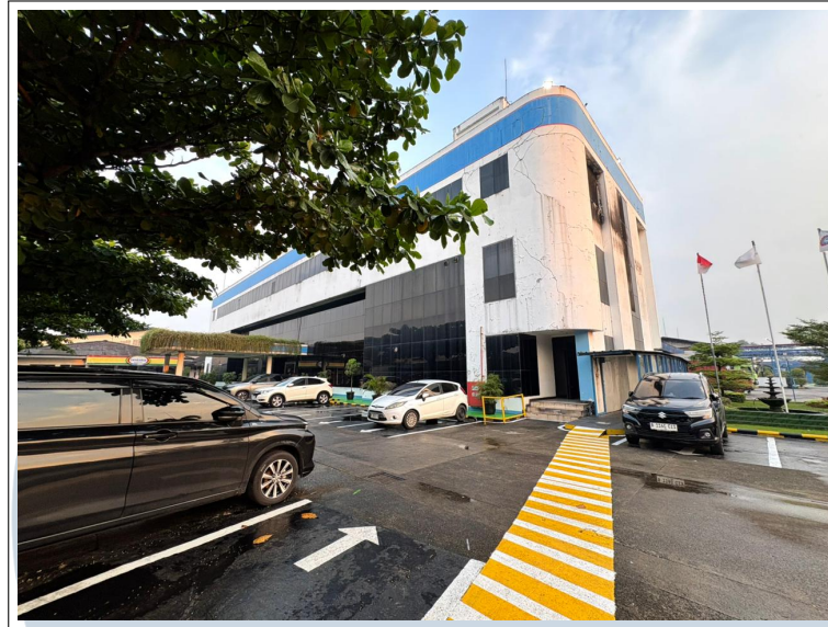
Gambar 2.2. Gedung Kantor PT. Indofood CBP Sukses Makmur Tbk – Unit Produksi Cikupa

Perjalanan operasional dan perkembangan fasilitas produksi PT. Indofood CBP Sukses Makmur Tbk, dirangkum dalam peristiwa berikut: