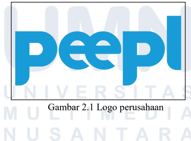
Gambar 2.1 Logo perusahaan

Dengan pengalaman lebih dari dua dekade, Peepl telah bekerja sama dengan berbagai institusi pemerintah, perusahaan milik negara, maupun perusahaan swasta dari berbagai sektor industri. Beberapa organisasi yang pernah bekerja sama dengan Peepl antara lain Otoritas Jasa Keuangan, Bank Mandiri, Bank Central Asia, Pertamina, Pupuk Indonesia, Freeport Indonesia, Garuda Indonesia, serta Trakindo Utama. Kolaborasi tersebut menunjukkan tingkat kepercayaan organisasi terhadap layanan dan solusi yang ditawarkan perusahaan. Keberagaman sektor industri tersebut mencerminkan kemampuan Peepl dalam menyesuaikan solusi HR sesuai kebutuhan organisasi yang berbeda [7].