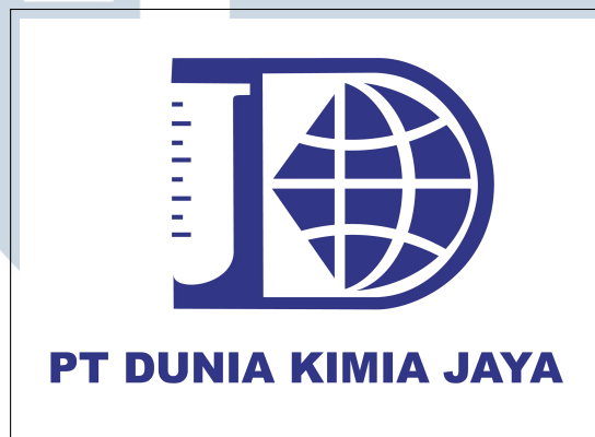
Gambar 2.1. Logo perusahaan PT Dunia Kimia Jaya

Gambar logo perusahaan PT Dunia Kimia Jaya dapat dilihat pada Gambar 2.1.